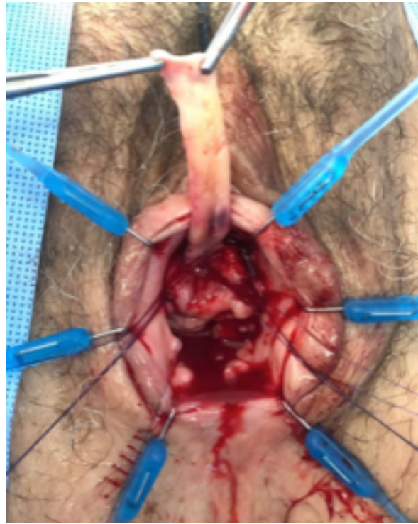
Figura 4. Reconstrucción uretral femenina con injerto de mucosa oral