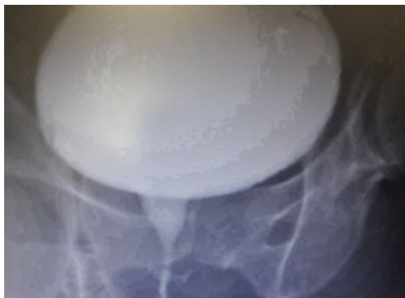
Figura 3. Uretrografía femenina