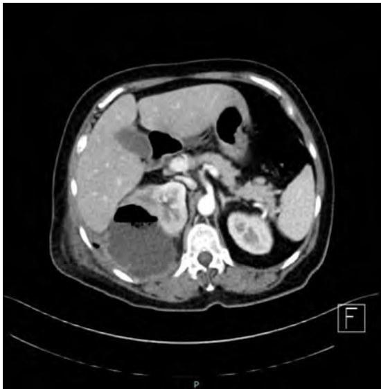
Figura 1. Tomografía contrastada corte axial. Quiste renal en polo superior con presencia de aire en su interior