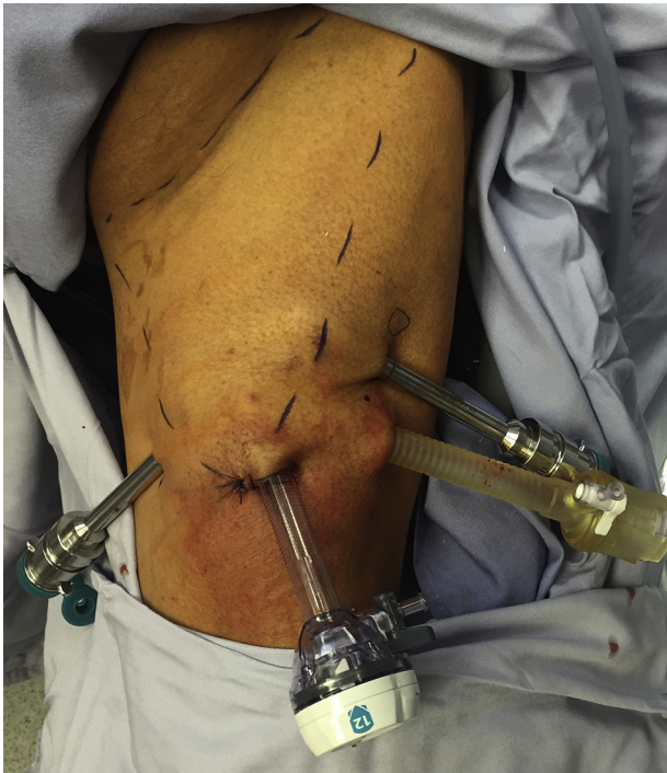
Figura 4 Colocación de trocares e identificación de triángulo femoral.

quirúrgico de 177.5 (132-400) min, un día de estancia hospitalaria (1-12 días), y 25 días de duración del drenaje (8-101 días). La complicación mayor en los pacientes incluyó un reingreso para drenaje, neumomediastino sin secuelas y celulitis superficial.