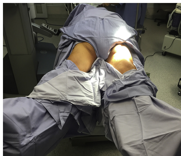
Figura 3 Posición y colocación del paciente con el sistema Da Vinci.

Carter et al. 11 realizó 19 disecciones endoscópicas inguinales, con un promedio de 11 ganglios por lado, tiempo