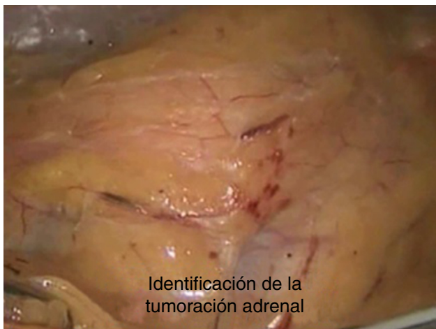
Figura 5 Tumoración suprarrenal.