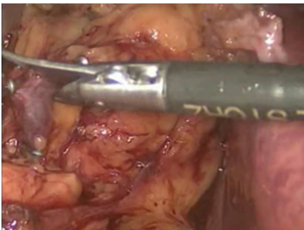
Figura 6 Clipaje metálico de vena suprarrenal y sección con tijera laparoscópica.

anterior y otro de a nivel de fosa iliaca derecha de 5 mm en línea axilar anterior (fig. 4); se insufla neumoperitoneo con 12 mmHg, se realiza maniobra de Catel con ligasure, se secciona el ligamento triangular hepático para una mejor movilización del hígado y obtener una mejor visualización del área quirúrgica; se ubica tumoración suprarrenal derecha la cual puede estar visible por debajo del peritoneo parietal posterior (fig. 5); el primer paso del procedimiento es incidir de manera longitudinal el peritoneo parietal de manera lateral a la vena cava inferior y esta incisión se prolonga de manera caudal hasta poder visualizar la vena renal en unión con la vena cava, además esta maniobra también ayuda a separar mejor el hígado de la tumoración adrenal; durante la disección la vena principal adrenal derecha se localiza y se liga con clips metálicos utilizando 2 clips de manera proximal a la vena cava y uno más de manera más lateral; una vez clipada la vena se secciona con tijera endoscópica (fig. 6). Una vez seccionada la vena adrenal, el espacio entre la pared lateral de la vena cava y la grasa periadrenal se abre para buscar entre estas el músculo psoas; se crea fácilmente un plano avascular entre la glándula adrenal y el músculo psoas, rodeando la glándula de tejido fibrograso, donde se encuentra la división de