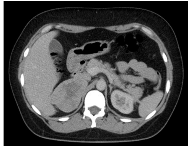
Figura 2 TAC de abdomen contrastada. Se identifica la lesión suprarrenal.

suprarrenal derecha. Paciente consiente, alerta, cooperativa, bien hidratada con adecuada coloración de piel y tegumentos; cabeza sin hallazgos, tórax normolíneo con adecuada entrada y salida de aire con campos pulmonares limpios, bien ventilados sin agregados, ruidos cardiacos rítmicos aumentados de frecuencia, buena intensidad, abdomen plano, sin cicatrices, peristalsis presente, no palpación de masas abdominales, no doloroso. Extremidades integra.