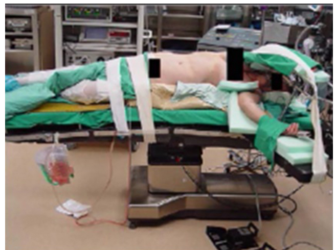
Figura 4 Posición del paciente para ser intervenido.