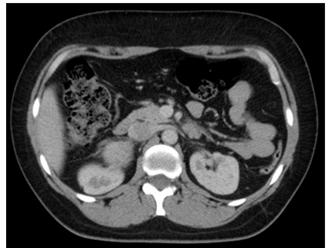
Figura 3 TAC contrastada con corte más alto, donde se identifica con claridad la lesión suprarrenal.

Se decide realizar adrenalectomía derecha laparoscópica; la paciente se hospitaliza 5 días previos al procedimiento quirúrgico para una adecuada preparación prequirúrgica en cuanto a cifras tensionales y precarga hídrica. Mantiene cifras tensionales prequirúrgicas de 160/95 mmHg a pesar del manejo con prazosin 1 mg/8 h y atenolol 50 mg/12 h. Se inicia procedimiento en una adecuada posición decúbito lateral izquierdo; se colocan 3 trocares, uno de 10 mm paraumbilical derecho, 2 trocares más uno de 10 mm en hipocondrio derecho en línea axilar