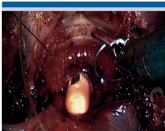
Figura 1. Anastomosis uretro-intestinal

Utilizamos una configuración con 6 trocres basados en la técnica de cistectomía descrita por Wiklund et al 8 . Para la creación de la neovejiga ortotópica el primer paso es la localización de la válvula ileo-cecal y posteriormente se mide una longitud de 20 cm a partir de la misma para seleccionar el segmento de íleon terminal que se utilizará para realizar el reservorio ileal con técnica de Studer. Posteriormente se coloca el intestino en la configuración aproximada sobre el lecho quirúrgico y se inicia con la anastomosis uretro-intestinal ( Figura 1 ), realizando una abertura de 20 Fr en el borde antimesentérico ileal, creando la unión con la técnica descrita por Van Velthoven con V-lok ® 3-0. Posteriormente se realiza el aislamiento de un segmento de 50 cm de íleon terminal con engrapadora laparoscópica automática con cartucho de 45 mm procurando realizar el corte perpendicular a las arterias del mesenterio intestinal. Posteriormente se realiza una anastomosis entero-enteral restaurando la continuidad intestinal de forma latero-lateral con un disparo de engrapadora longitudinal y uno transversal en forma de T. Detubularizamos el segmento proximal de 40 cm en el borde anti-mesentérico, preservando 10 cm de asa aferente.