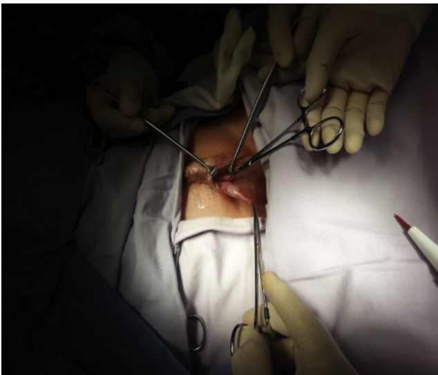
Figura 3 Disección de testículo y cordón espermático.

efectuando incisión transversa en escroto unilateral o bilateral de acuerdo a cada caso (fig. 2); se efectuó apertura de dartos, el testículo fue desprendido del gubernaculum testis, y tanto el testículo como el cordón espermático se liberaron de tejido laxo circundante (fig. 3). Disecando hacia el anillo inguinal interno, se efectuó hemostasia minuciosa, en todos los casos se abrió el conducto peritoneo vaginal (solamente en 3 procedimientos se encontró permeabilidad de este conducto el cual fue cerrado con monocryl 5 ceros), el testículo fue fijado con un punto a dartos con monocryl 5 ceros y otro punto de fijación del testículo hacia un botón externo (fig. 4). Se cerró por planos, se aplicó Dermabond (2-octil cianoacrilato) sobre la herida escrotal ya cerrada, se aplicó tintura de benjuí alrededor de la herida escrotal como fijador y se colocó tegaderm como protector de la herida y varias gasas sobre el tegaderm para que funcionaran como barrera contra la orina. El material de sutura empleado para cerrar el escroto fue material absorbible, el cual desapareció en varias semanas. Todos los pacientes recibieron antibiótico y analgésico vía oral para