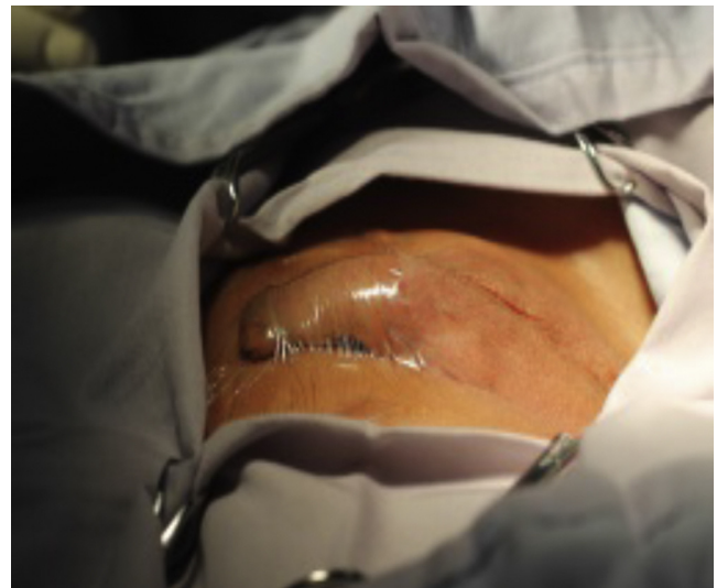
Figura 1 Aislamiento del pene con tegaderm.

criptorquidia unilateral o bilateral y parálisis cerebral. Las variables incluidas fueron: parálisis cerebral, criptorquidia unilateral, criptorquidia bilateral, criptorquidia recidivante, edad, lugar de residencia, tiempo operatorio, presencia o ausencia de infección postoperatoria y técnica quirúrgica vía escrotal. El comité de ética en investigación del CRIT Puebla dictaminó como aprobado este protocolo de investigación. El responsable legal del paciente firmó el consentimiento informado, recibió información detallada del procedimiento, además se entregó tríptico informativo acerca del procedimiento quirúrgico, a todos los pacientes se les solicitó biometría hemática completa y tiempos de coagulación completos, todos tuvieron valoración preanestésica. El procedimiento fue ambulatorio, la técnica anestésica empleada fue bloqueo peridural caudal, se realizó aseo quirúrgico abdominal y genital con clorhexedina mediante un dispositivo cerrado y estéril, se aplicó preoperatoriamente ceftriaxona por vía intravenosa cuya dosis fue calculada según los kilos de peso de cada paciente a 100mg/kg en dosis única; se aisló el pene colocando tegaderm sobre él para evitar manipularlo durante el procedimiento quirúrgico (fig. 1), y la operación se realizó