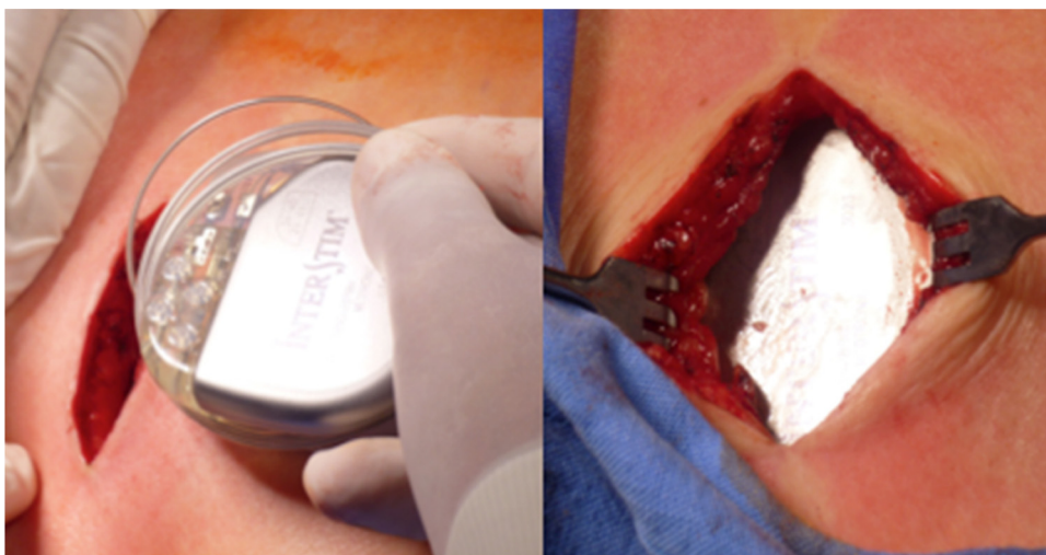
Figura 3 En la fase definitiva se coloca el neuromodulador en el reservorio subcutáneo.

El análisis de los parámetros comparativos se realizó en la población total incluida en el estudio. Así mismo se realizó análisis separado por género y patologías (tabla 3).