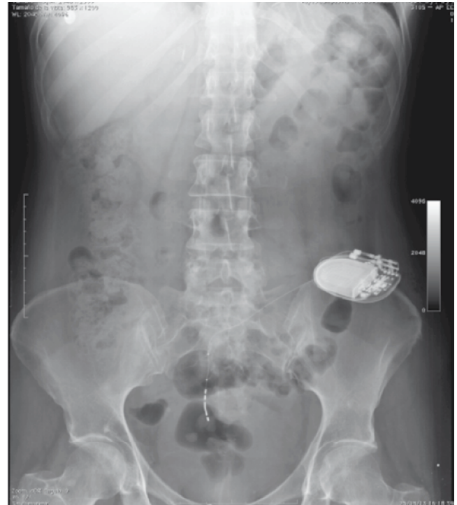
Figura 3 Radiografía simple de abdomen que evidencia la adecuada colocación del implante.

La NRS es beneficiosa en el tratamiento de pacientes con disfunción miccional crónica idiopática que no responde a tratamiento conservador. El manejo de estos pacientes es complejo. Las alternativas terapéuticas para los pacientes retencionistas son: el cateterismo intermitente limpio o la sonda permanente, y en los cuadros de urgencia-frecuencia