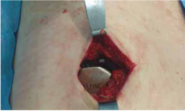
Figura 2 Generador de impulsos (Medtronic InterStim®) colocado en el plano subcutáneo del cuadrante superior externo en el glúteo derecho.

Los diarios de continencia se completaron por 2 semanas más posterior al implante definitivo. Durante el seguimiento observamos que los diarios de hábitos urinario (tabla 1) mejoraron aún más, posterior al implante definitivo. Los episodios de incontinencia prácticamente desaparecieron. No se registraron más síntomas de urgencia urinaria, y la frecuencia diurna y nocturna disminuyó considerablemente. Se solicitó a la paciente completar nuevamente índices de gravedad de síntomas y de calidad de vida de incontinencia urinaria y fecal, 60 días luego de la colocación del implante definitivo. La evaluación de los diarios urinario fue satisfactoria. Presentó disminución significativa en los índices de gravedad de la incontinencia urinaria ( Sandvik Severity Index ), así como en el cuestionario de impacto de la incontinencia urinaria en la calidad de vida (Potenziani). La paciente manifestó notable mejoría en su calidad de vida y presentó mejores puntuaciones en cuanto estilo de vida, conducta y depresión (tablas 2 y 3).