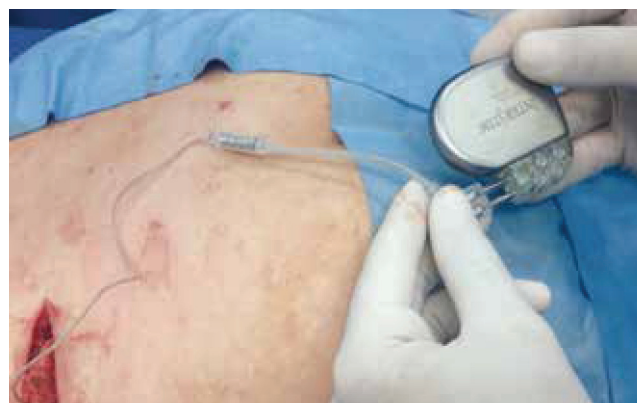
Figura 1 Fase crónica: se implantó en forma definitiva el generador de impulsos.