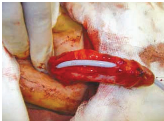
Figura 2 Se abre uretra y se recorta el excedente del divertículo uretral.

Existe controversia sobre la clasificación de los divertículos de la uretra. La clasificación que se utiliza con mayor frecuencia es la propuesta por Watts en 1906, quien los dividió en congénitos y adquiridos. En el primer caso está implicado el espesor completo de la pared uretral, encontrándose revestido de epitelio; los adquiridos están revestidos por tejido de granulación y sus paredes carecen de fibras musculares 6 .