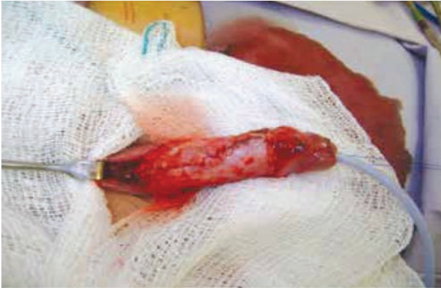
Figura 3 Se realiza cierre de uretra sobre sonda Foley 8Fr, con sutura PDS™ 6-0 en 2 planos, se coloca parche de fascia subdérmica.

Podemos definir los divertículos uretrales del hombre como “primarios” de origen congénito y “secundario” de origen adquirido 2 . Estos pueden encontrarse a lo largo de la uretra anterior, sin embargo lo más frecuente es a nivel de la uretra bulbar; estos se pueden dividir en 2 variedades, sacular y globular, según su apariencia radiológica y a excepción de la fosa navicular casi siempre surgen en la pared ventral de la uretra 3 . Los divertículos congénitos de la uretra son una patología muy rara que puede ocasionar obstrucción urinaria o infecciones, así como otra sintomatología dependiendo del tamaño y tipo de divertículo. Aparentemente los signos y los síntomas derivados de esta enfermedad son típicos y el diagnóstico es sencillo, no obstante muchos niños afectados por este padecimiento permanecen sin diagnosticarse 2 . La causa embriológica permanece desconocida, habiéndose postulado varias teorías como falla en el cierre de los pliegues uretrales, atrofia primaria de la pared central de la uretra, falla en el desarrollo de las capas uretrales, alteración del riego sanguíneo y falla en el desarrollo del cuerpo esponjoso 2 . La experiencia clínica evidenciaría que apenas un 10% de todos los divertículos reconocerían este origen 2 .