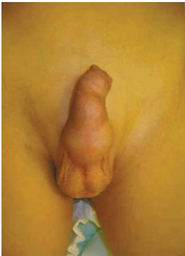
Figura 1 Se observa aumento del tamaño de predominio ventral, vista anterior.

Preescolar de 5 años de edad, que acudió por presentar “incontinencia urinaria” desde el nacimiento, sin antecedentes de traumatismo, cateterismos previos, cirugías, ni infecciones urinarias recurrentes. En la exploración física se encuentra en buen estado general, apariencia masculina, con un pene no circuncidado aumentado de tamaño sobre su parte ventral y prepucio retráctil (fig. 1). A la presión digital