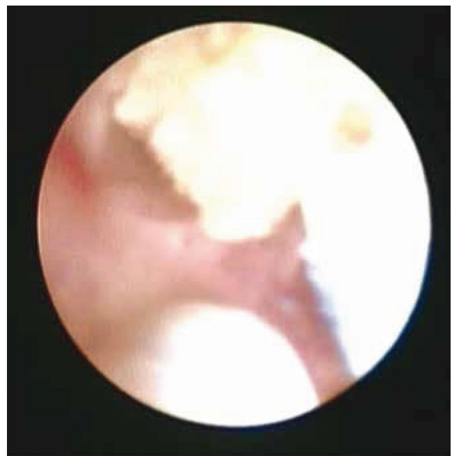
Figura 2 Se introduce catéter de 3 Fr de dispositivo Back-Stop™ para su aplicación.