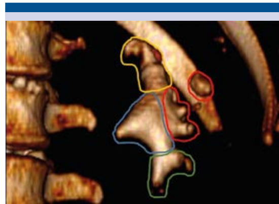
Figura 2. Reconstrucción volumétrica en un modelo de superficie en 3D de un lito coraliforme. La morfometría litiasica se demuestra de la siguiente manera; Azul=Volumen litiasico pélvico, Verde= Volumen litiasico cáliz de entrada, Naranja= Volumen litiasico cáliz favorable, Rojo= Volumen litiasico cáliz no favorable. 11

Los pacientes se clasificaron según lo descrito por Mishra y colaboradores en tres tipos: Tipo 1 : litos coraliformes con un volumen litiasico total menor de 5000 mm 3 más volumen litiasico cáliz