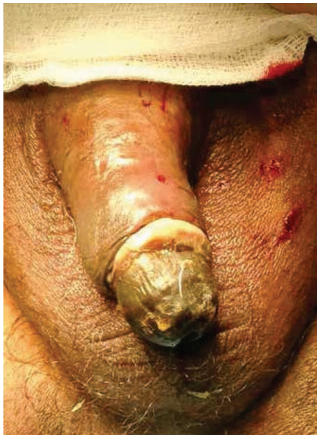
Figura 2 Datos de balanitis y escara.

Laboratorios: leucocitos 15,100/mm 3 , hemoglobina 8.3, hematocrito 26.7, plaquetas 275,000, glucosa 105, urea 82, creatinina 3.70, Na + 141, K + 4.3, Cl - 102, albúmina 1.99, TP 20.6, TTP 72.5, Ca +2 7.92 mmol/L, fósforo 7.36 mmol/L.