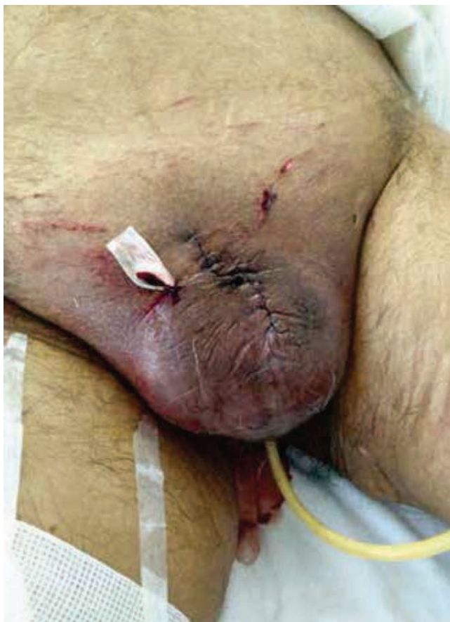
Figura 4 Posquirúrgico inmediato con uretrotomía perineal.

arterias, las calcificaciones intravasculares pueden tener su origen en el hiperparatiroidismo secundario a hiperfosfatemia. Este hiperparatiroidismo conlleva al aumento de la absorción intestinal de calcio y su reabsorción renal. Este estado condiciona el aumento de calcio en sangre y su depósito en los tejidos (calcifilaxis).