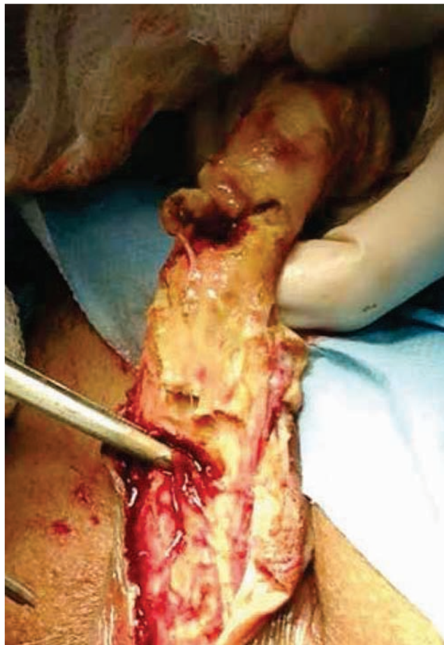
Figura 3 Compromiso de los tejidos y la uretra en el transquirúrgico.

La calcifilaxis es una condición sistémica poco común, se observa en el 1%-4% de los pacientes con insuficiencia renal crónica terminal en tratamiento sustitutivo, la presentación clínica consiste en manchas rojizas en la piel y lesiones