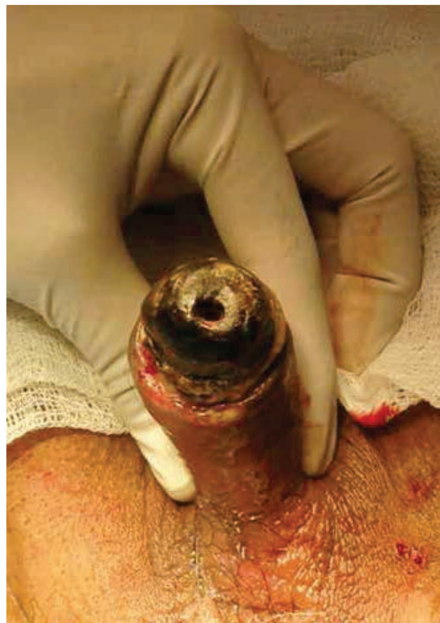
Figura 1 Necrosis de pene.

Dos semanas posteriores al evento quirúrgico, se encuentra escara de 10 x 15 cm, con salida de abundante material purulento fétido.