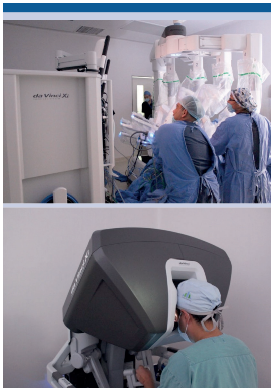
Figura 1. Equipo médico durante la primera cirugía con el sistema da Vinci® Xi™ en México.

El paciente tuvo evolución posquirúrgica favorable, por lo que se retiró la sonda transuretral ocho días después y mostró continencia urinaria completa en los siguientes dos días. Se observó orquiepididimitis derecha a los 15 días, se prescribió antibioticoterapia y a 10 semanas del posoperatorio reportó erecciones adecuadas