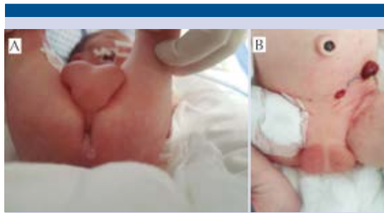
Figura 1. Bolsa escrotal íntegra con testículos en su interior, ano perforado con fístula uretrocutánea perianal (A), afalia con presencia de derivación intestinal (B).